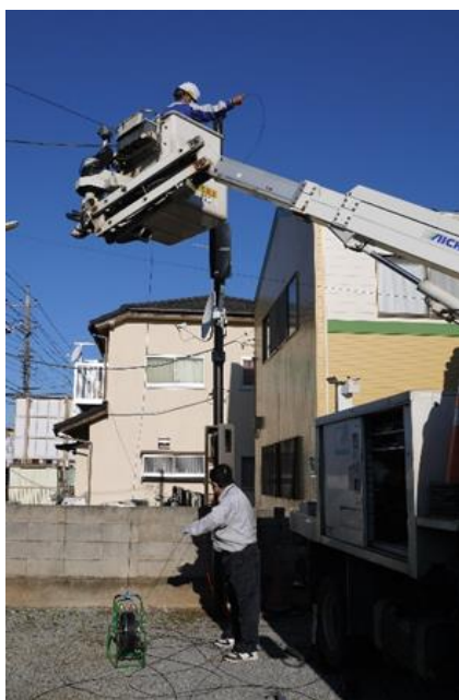
（光回線引込工事 12月8日）